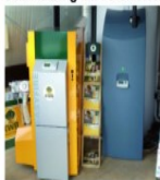
Musteranlagen in Funktion

ALLES AUS EINER HAND! MIT QUALITÄT & SERVICE! WIR MODERNISIEREN BAD u. HEIZUNG ZUM FESTPREIS! Besuchen Sie unsere große Bäder- u. Heizungsausstellung