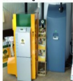
Musteranlagen in Funktion