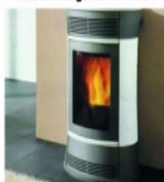
Form schöne Pelletöfen

ALLES AUS EINER HAND! MIT QUALITÄT & SERVICE! WIR MODERNISIEREN BAD u. HEIZUNG ZUM FESTPREIS! Besuchen Sie unsere große Bäder- u. Heizungsausstellung