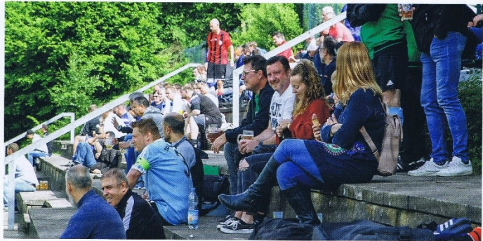
Die zahlreichen Turniere ziehen jedes Jahr viele Besucher auf die Tribünen des Waldstadions.