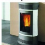
Form schöne Pelletöfen

ALLES AUS EINER HAND! MIT QUALITÄT & SERVICE! WIR MODERNISIEREN BAD u. HEIZUNG ZUM FESTPREIS! Besuchen Sie unsere große Bäder- u. Heizungsausstellung