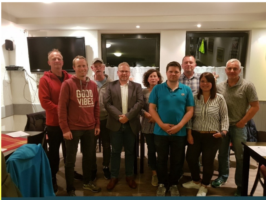
Der neue Vorstand des FCV