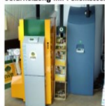
Musteranlagen in Funktion