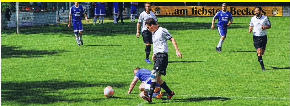
Spannende Zweikämpfe sorgten bei den Turnieren für gute Unterhaltung.

fest der Viktoria stark belastet. Sonntag und Montag standen die Turniere der G-, E-, F- und FD-Jugend im sportlichen Mittelpunkt. Bei einem Skatturnier wurden Sonntagnachmittag die Karten gereizt.