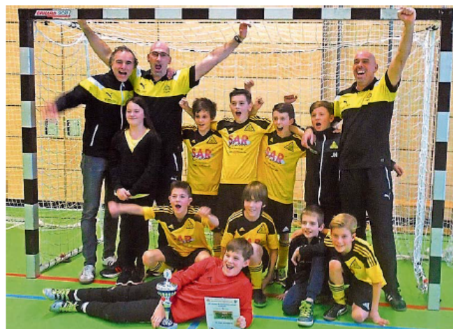
Jubel in Gelb und Schwarz: Für eine faustdicke Überraschung sorgten die E-Junioren des FC Viktoria St. Ingbert. Sie gewannen als krasser Außenseiter in der Wallerfeldhalle den Titel des Futsal-Kreismeisters.

Über zwei Tage herrschte eine tolle Stimmung in der Halle, was wohl auch daran lag, dass zwei Titel in St. Ingbert blieben. Gleich zu Beginn sorgten die E-Junioren von Viktoria St. Ingbert für eine faustdicke Überraschung, als sie den