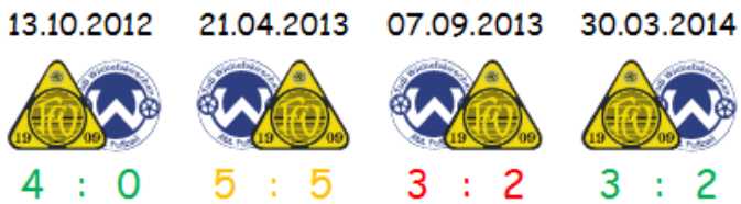
Tabelle der Vorsaison